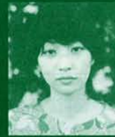
「ウルトラリアルラブストーリー」 監督 横浜聡子