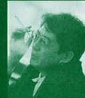
脚本家 荒井 晴彦