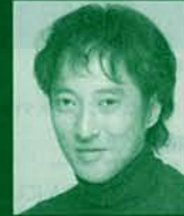
「白鳥の歌」 監督 斎藤 歩