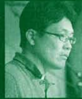
「童貞放浪記」 監督 小沼雄一