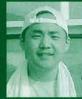
「私の叙情的な時代」 監督 任 書剣