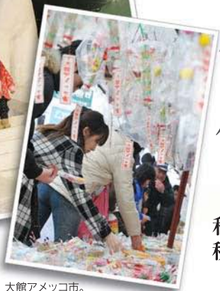
大館アメッコ市。露店には鮎がズラリと並ぶ。