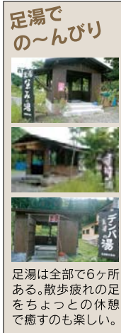
足湯は全部で6ヶ所ある。散歩疲れの足をちよつとの休憩で癒すのも楽しい。

〒012-0183 秋田県湯沢市皆瀬字湯元100-1 TEL.0183-47-5151 FAX.0183-47-5208 HP http://www.motoyukurabu.jp/