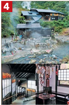
情緒溢れる天然川風呂からの温泉の湯気