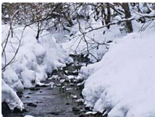
雪深い田沢湖の沢水で育つ魚たちは、水の冷たさに揉まれ、身が引き締まる。

旅行者や出張客が土産で買って帰り、また、食べたいと注文をしてもらいうことが多いため。他にも岩魚の一夜干し、鱒のソフトスモークなど加工品も多数取りそろえている。