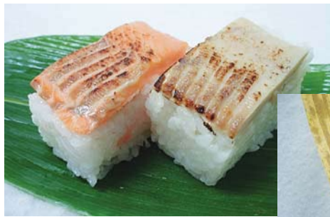
縁起も良い紅白の紅ますの押し寿司。