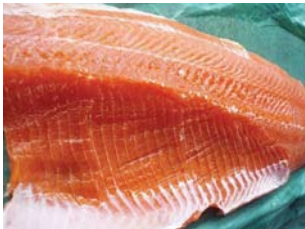
鮮やかな紅色をした、ますの切り身。そして白身には、季節によって虹ます、ヤマメそして岩魚を使用する。