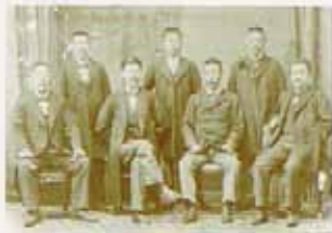
秋田師範学校の教授陣。