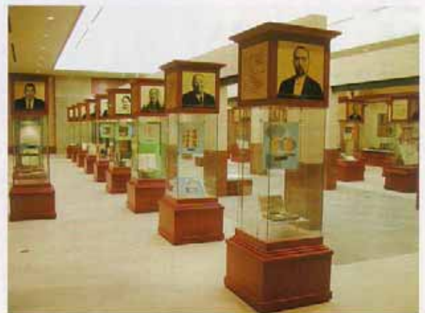
秋田の先覚記念室