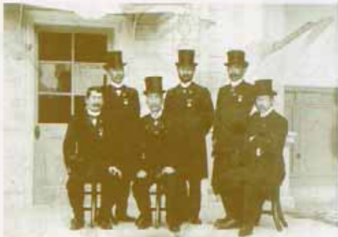
髭と帽子がサマになっている。