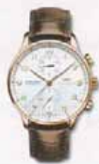
IWC SCHAFFHAUSEN ポルトギーゼ クロノ・オートマティック

IWCの代表モデルと時計同好会についてはAgホームページへ http://www.ag55.com