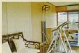
日当たりの良いトレーニングルーム