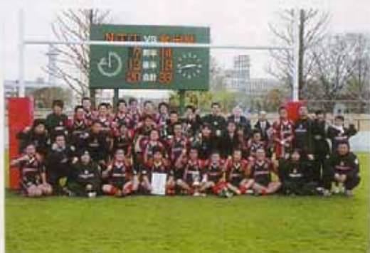
ノーゼンブレッツのメンバー

ている人物のみが、目立ってしまうかもしれないが、守る人間がいるから、運べる。球を奪取する人間がいるからゴールを目指して行けるのですよ。つまり、