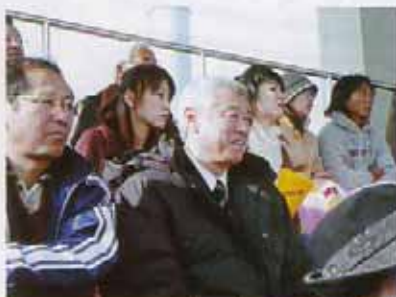
ノーゼンブレッツの試合観戦