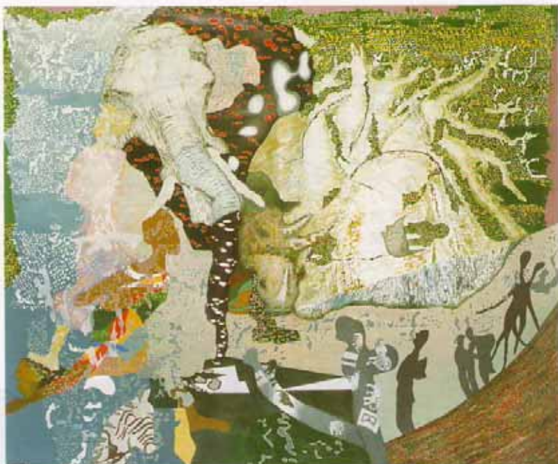
第70回記念旺玄会展(2004) 旺玄会賞 悠々 パオバブ