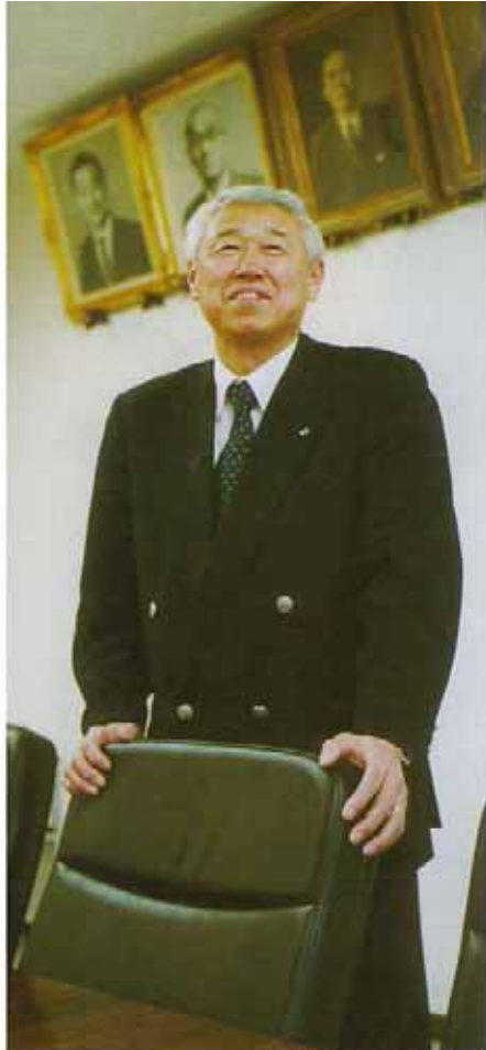
歴代社長の写真の前で

私の生活の基本はラグビーの精神にあります。一人は一人ではなく、みんなのために存在する。みんなは、一人のために存在する。フオワードが体をはってボールを奪い取り、バックスはボールを華麗に運ぶ。走っ