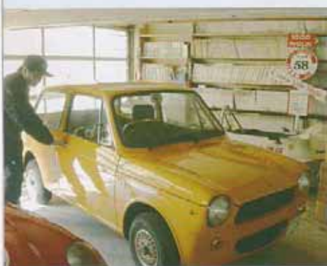
オーナーの希望でドア以外は全てカスタム化されている

現代の車なら、室内温度を設定してオートエアコンを入れておけば、春夏秋冬に関わらず快適にドライブ出来るが、それは全てに良い事なのだろうか? 現代の車で普通に出来る事が、何も出来ないNではあるが、そんなNが私は大好きだ。Nの室内は、肩が触れあうくらいに狭いので、家族との会話がとても近く心地良い。坂道が見えたら、手前から加速させるためエンジン音が急に大きくなるので、家族にも坂道が近い事が判る。現代の車には、とても小さな坂でも、Nは一生懸命に登る。