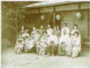
家庭ではまだ和服が一般的だった。

平成の我々が思い浮かべる「明治男」の外見的なイメージは、どのようなものだろうか。手入れの行き届いた口髭、見るからに度が強そうな丸眼鏡、重々しく頑固そうな表情などが浮かんでくるが、今回注目したいのは、彼らが日本で初めて洋服を着こなした人達だということだ。 明治という激動の時代を生きた彼らに会い、「秋田の先覚記念室」へ足を運ぶ。この展示室は、博物館に6つある展示室の中でもひととき異彩を放っている。ガラスの角柱に整然とモノクロの肖像写真が並ぶ様子は、まさに「時代」を視覚的に感じるメモリアル・ホール。そこには洋服の写真と和服の写真が入り交じる。当時はまだ和服の人が多く、洋服を着ていた人は少数派だったのだから、先覚者達の洋服姿は不思議なほど決まっただけで、100年も昔の写真であっても違和感を感じさせない。